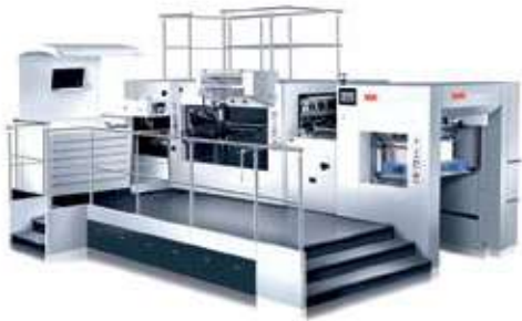
Easymatrix 106 CS