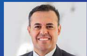
ازدهار سوق طباعة الديكور وضرورة اعتماده من قبل مزودي خدمات الطباعة