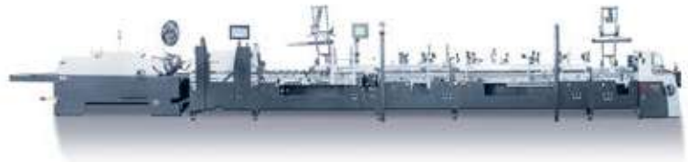
Diana Easy 115

The complete "golden" solution for commercial and packaging printing, an ideal for small and medium enterprises.