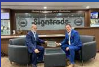
FESPA Middle East Adds Floor Space to Meet Industry Demand