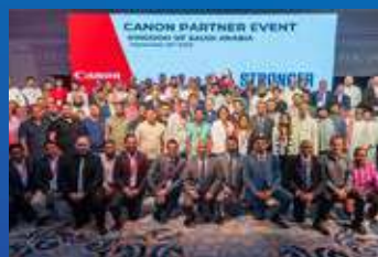
Saudi Imaging & Printing Market to Quadruple by 2030