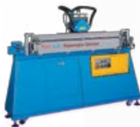
Automatic Squeegee Sharpener