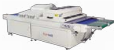
UV Conveyor Dryer (UVC+IR+UVA) KY-72BII-I (29") KY-105BII-I (42")