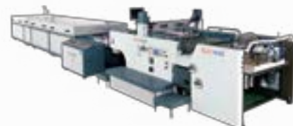
Rear Pick-Up Rotary Stop Cylinder Press (Compatible with High Efficiency Hot Air Conveyor Dryer, UV Dryer)