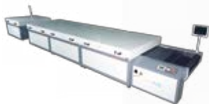
High Efficiency Hot Air Conveyor Dryer

4-6 kWh lamp is optional and customized lamp is available.