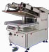
Clamshell Semi-Auto Screen Printing Press