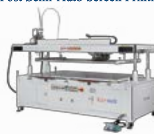
Four-Post Semi-Auto Screen Printing Press