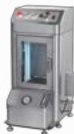
Vacuum Type Non-bubble Ink Shaking Mixer