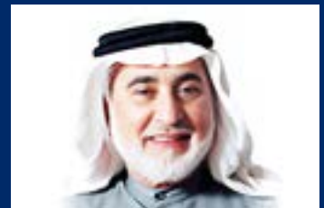
مجلة مي برينتر تنعي بكل الأسف أبو صناعة الطباعة في الخليج العربي "علي الهاشمي"