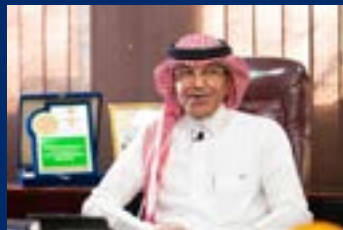
Saudi Xerox and SIPC: Tale of a Great Journey Along Kingdom's Visionary Road