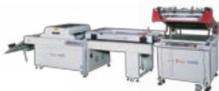
Clamshell 3/4 Automatic Screen Printing Press