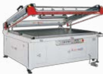
Clamshell Semi-Auto Screen Printing Press