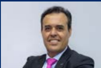
Special contributor to this issue: Shadi Bakhour, Business Unit Director, Canon Middle East