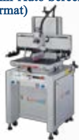
Single Arm Semi-Auto Screen Printing Press (large format)